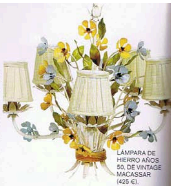
LÁMPARA DE HIERRO AÑOS 80. DE VINTAGE MACASSAR (425 €).

A través de este exclusivo portal se puede organizar una boda excepcional. Aquí encontrarás los mejores proveedores, que están tras haber pasado un exhaustivo control de calidad: caterings, invitaciones de lujo, fotógrafos, etc.